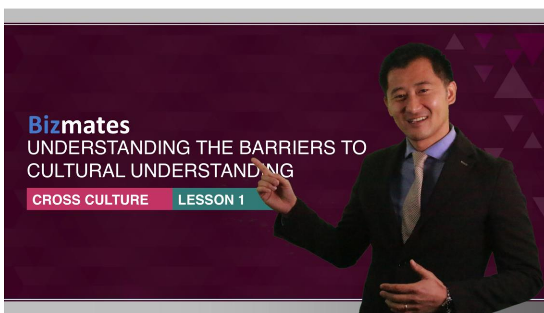
Cross Culture Video Lesson

今回、その5つ中の「Diversity(異なる文化や価値観を受け入れるマインド)」に、よりフォーカスし、グローバルビジネスで成果を上げるための、異文化コミュニケーションスキルの修得を目的とした新しい英会話学習プログラムを開発いたしました。